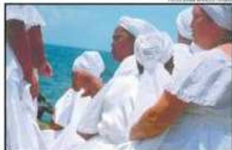
As imagens da Festa de Iemanjá, feitas por Jorge Beraldo, ano passado, durante as homenagens à Rainha do Mar, em Salvador, esboçam o bem-cuidado encarte do CD e remetem às canções praias do homenageado