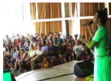
MUSEU PAMPULHA - Belo Horizonte-BH