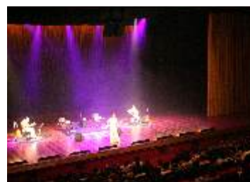
AUDIT. IBIRAPUERA - São Paulo-SP