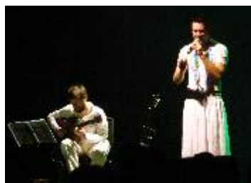
SESI SÃO BERNARDO - S. Bernardo-SP