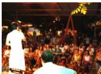
ESPAÇO VEJA - Riviera-SP