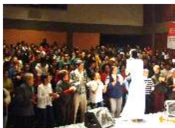
SESI OSASCO - Osasco-SP