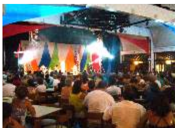
SESC BERTIOGA - Bertiooga-SP