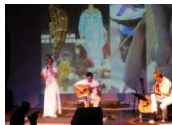
THEATRO VASQUES - Mogi das Cruzes-SP