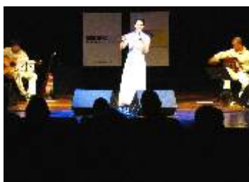
SESC SOROCABA - Sorocaba-SP