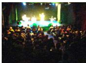
SESI MAUÁ - Mauá-SP