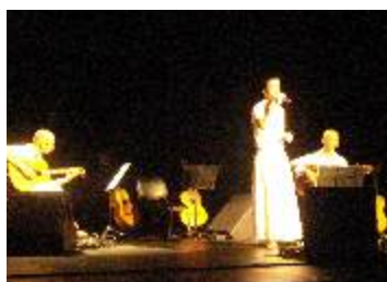
SESC IPIRANGA - São Paulo-SP