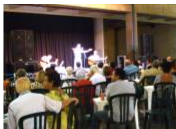
SESC ARARAQUARA - Araraquara-SP