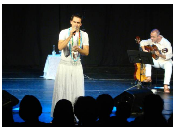
SESI PIRACICABA - Piracicaba-SP